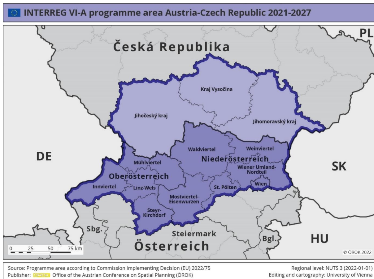
Obrázek 2: Mapa programového území

Pro programové území jsou také relevantní dvě makroregionální strategie (EUMRS): Strategie EU pro Podunají (EUSDR) a Strategie EU pro alpský region (EUSALP). Propojením s EUSDR a EUSALP se docílí většího územního dopadu Programu a realizace kvalitních projektů s optimálním strategickým zaměřením a lepším zviditelněním.