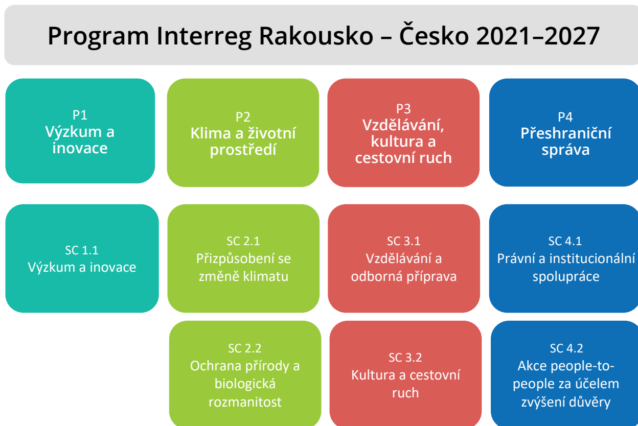
Obrázek 3: Priority a specifické cíle

Program Interreg Rakousko – Česko 2021–2027 podporuje projekty ve čtyřech tematických prioritách (P). Ty jsou dále rozděleny do sedmi specifických cílů (SC):